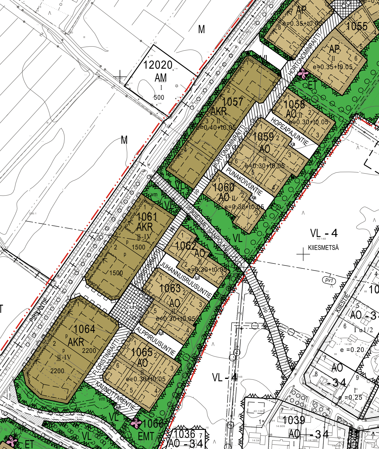
Vaihtokirja kiinteistö 244-401-19-178, palsta 1, liitekarta 3